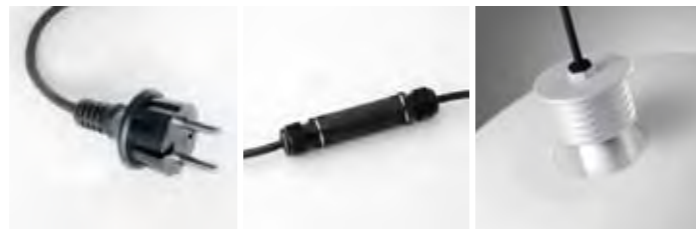
Outdoor Gregg media