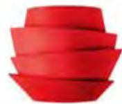
rosso / red