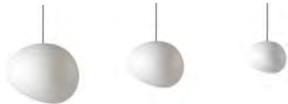
Outdoor Gregg X-large