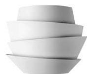
bianco / white