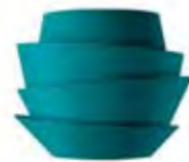
acquamarina / aquamarine