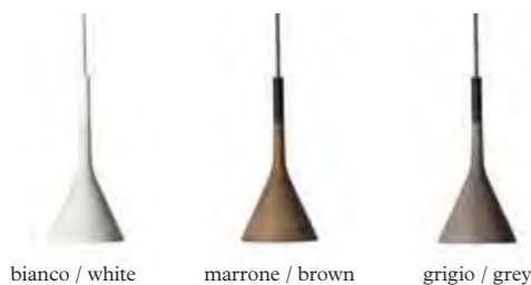
bianco / white