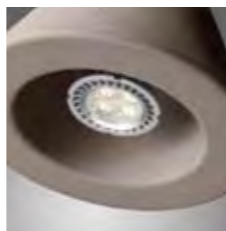
grigio / grey